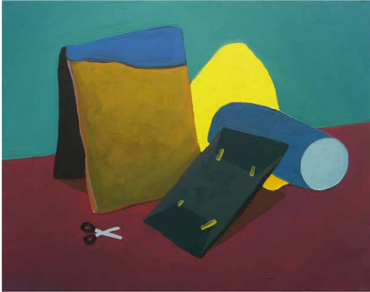
„Hinterhaus“, 100 x 70 cm, Öl auf Leinwand, 2017