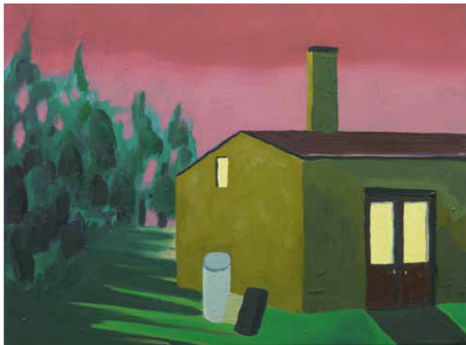
„Greifendorf“, 30 x 40 cm, Öl auf Leinwand, 2015