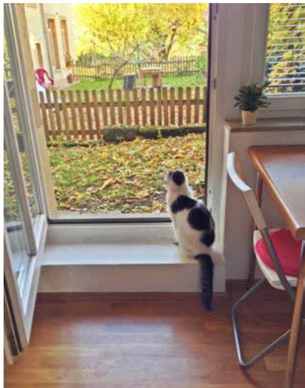
Abb. rechts: „Garten (Katze)“, 20 x 25 cm, Bleistift auf Papier, 2017