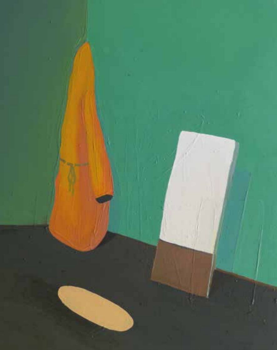
„Jacke“, 50 x 40 cm, Öl auf Leinwand, 2015