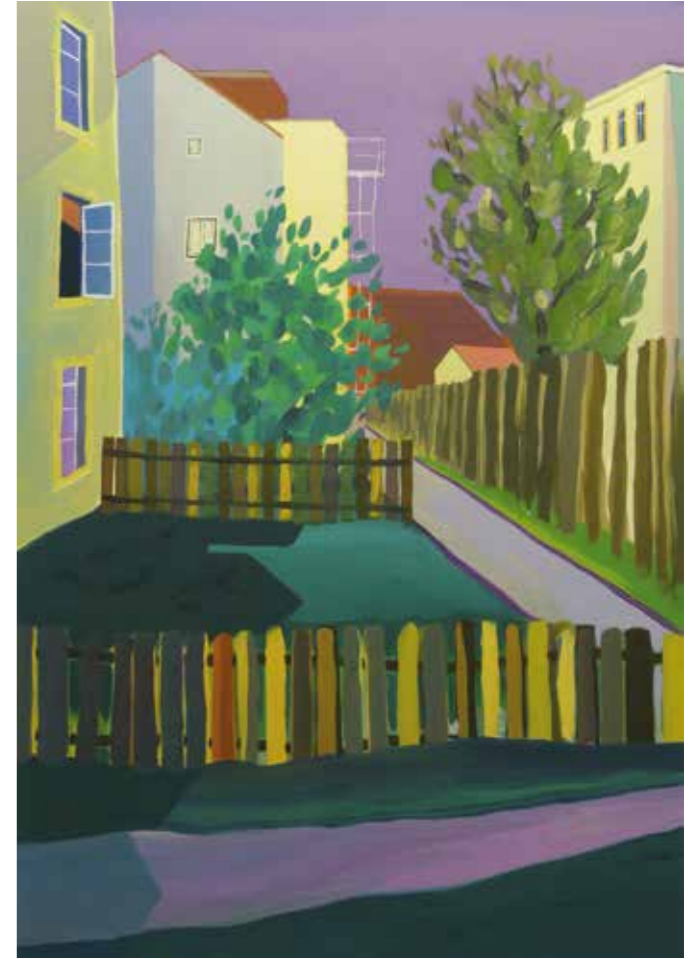
Abb. links: „Gerümpel“, 50 x 60 cm, Öl auf Leinwand, 2014