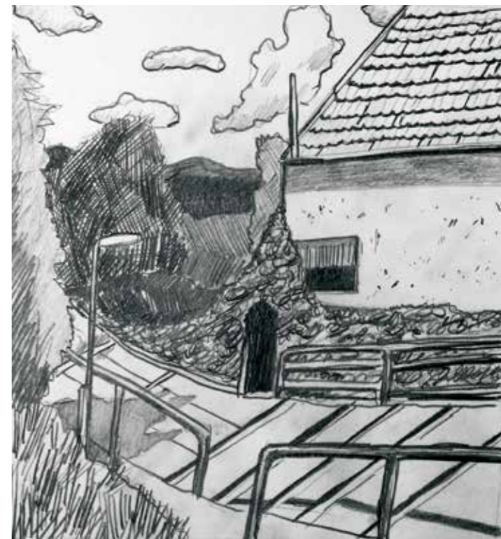
„Bannewitz“, 20 x 15 cm, Bleistift auf Papier, 2017