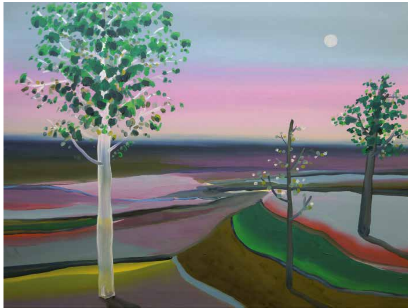
Abb. folgende Seite: „Meißen“, 20 x 60 cm, Öl auf Leinwand, 2017

Abb. rechts: „Landschaft mit Mond“, 60 x 80 cm, Öl auf Leinwand, 2015