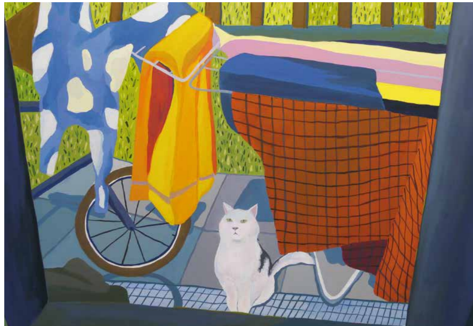
Abb. rechts: „Garten (Katze)“, 80 x 100 cm, Öl auf Leinwand, 2017