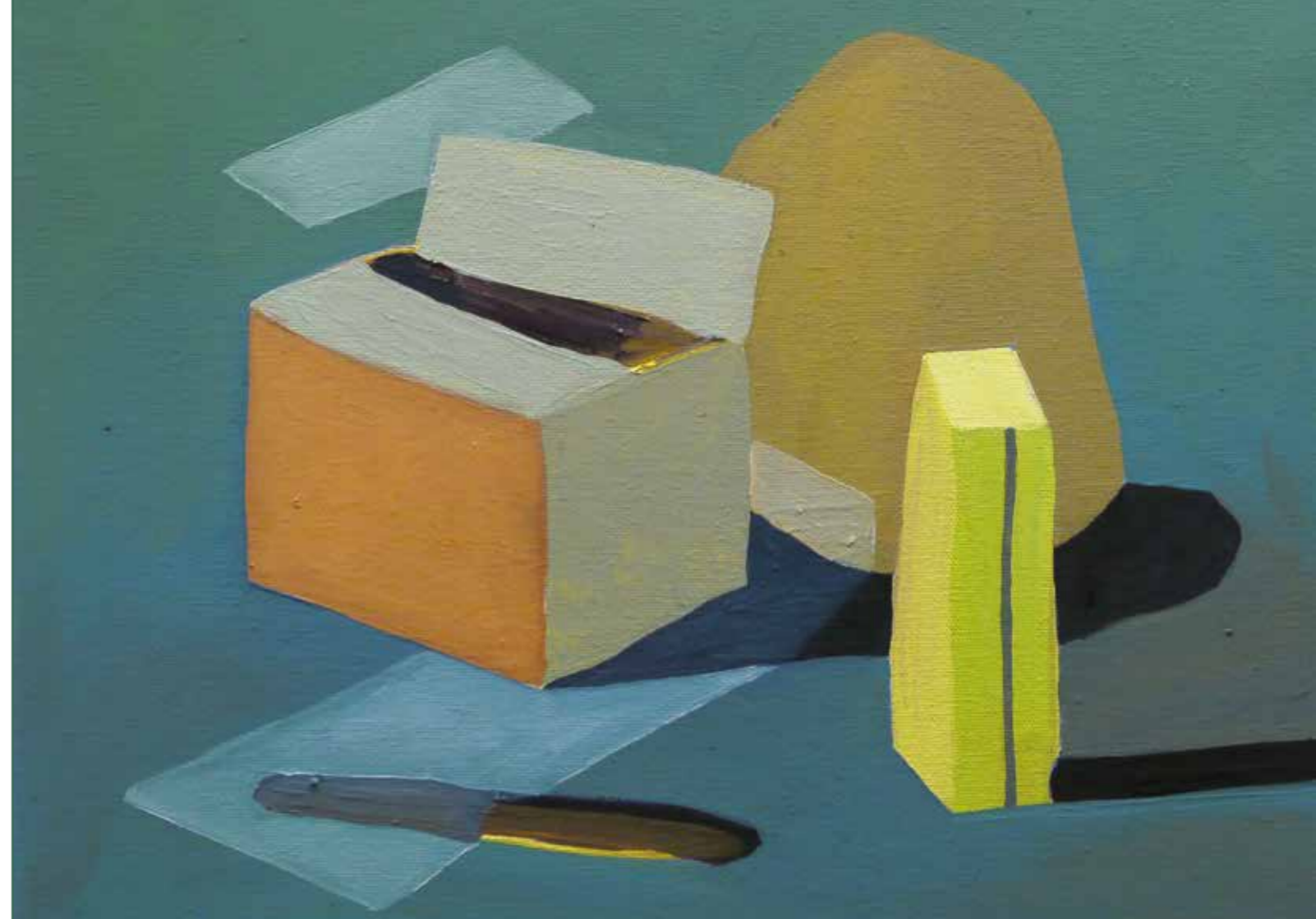
Abb. rechts: „Kisten“, 30 x 40 cm, Öl auf Leinwand, 2016

Abb. Titel: „Meißen“ (Ausschnitt), 20 x 60 cm, Öl auf Leinwand, 2017