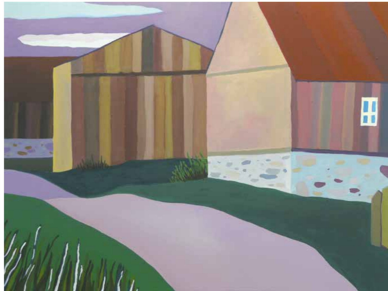
Abb. rechts: „Dorf“, 80 x 100 cm, Öl auf Leinwand, 2015