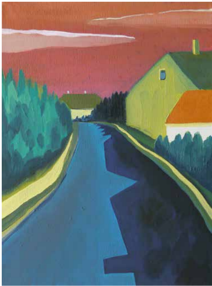
„Gleisberg“, 40 x 30 cm, Öl auf Leinwand, 2016