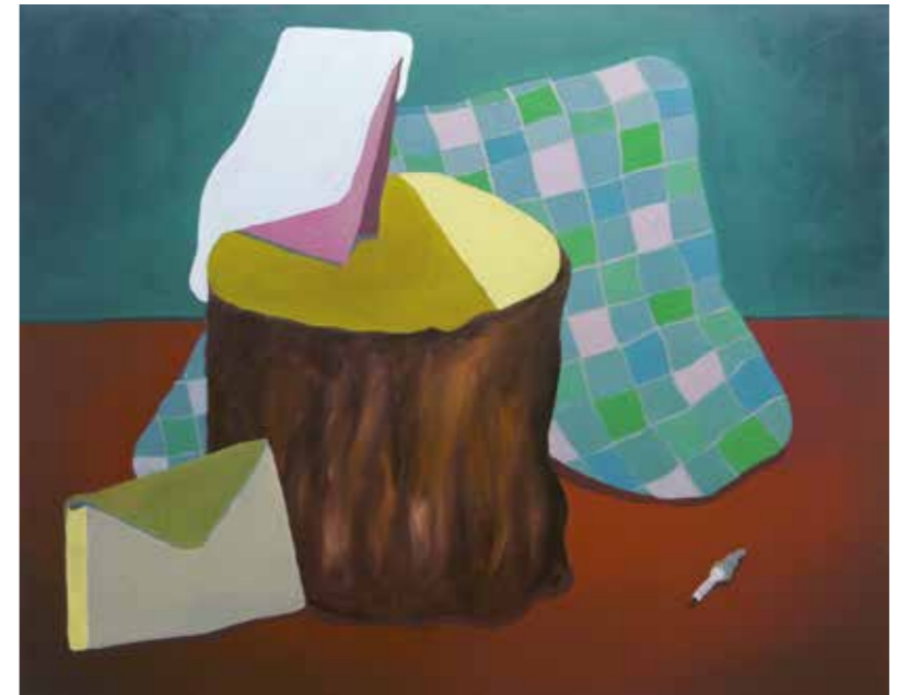
„Holz“, 90 x 100 cm, Öl auf Leinwand, 2015