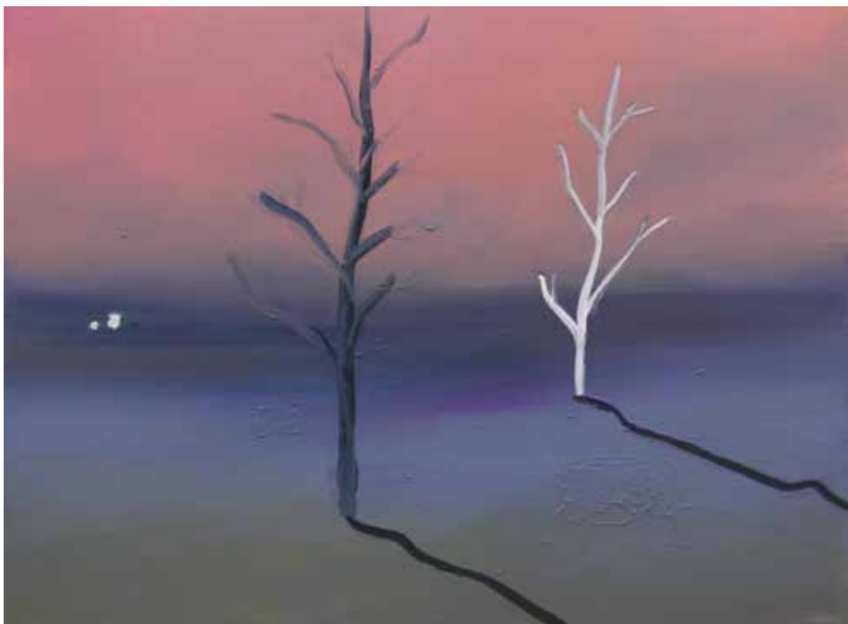
„Bäume“, 30 x 40 cm, Öl auf Leinwand, 2016