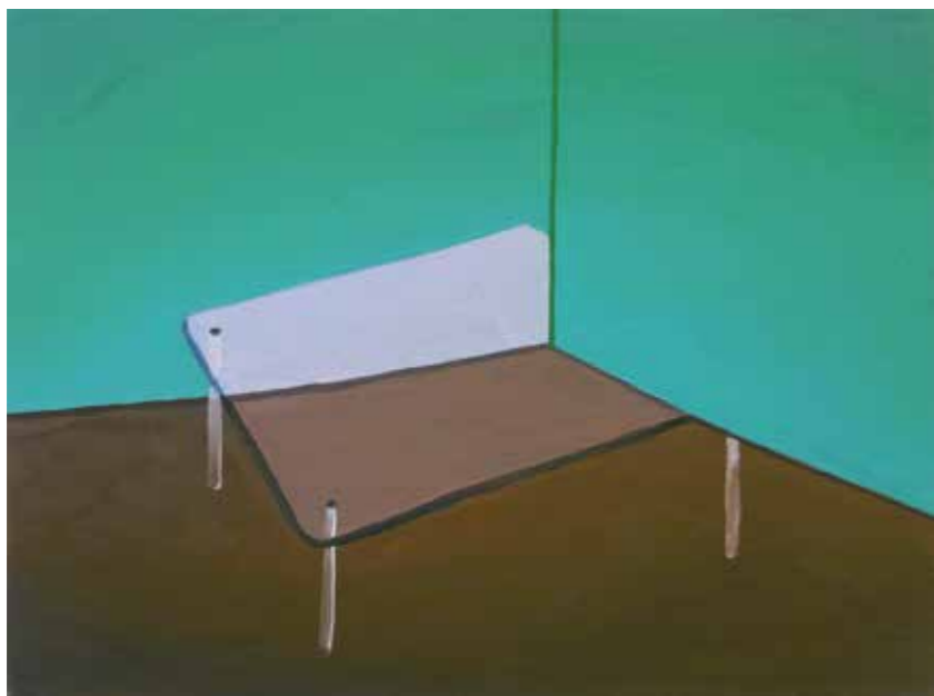
„Tisch“, 30 x 40 cm, Öl auf Leinwand, 2016

Abb. rechts: „Landschaft mit Mond“, 60 x 80 cm, Öl auf Leinwand, 2015