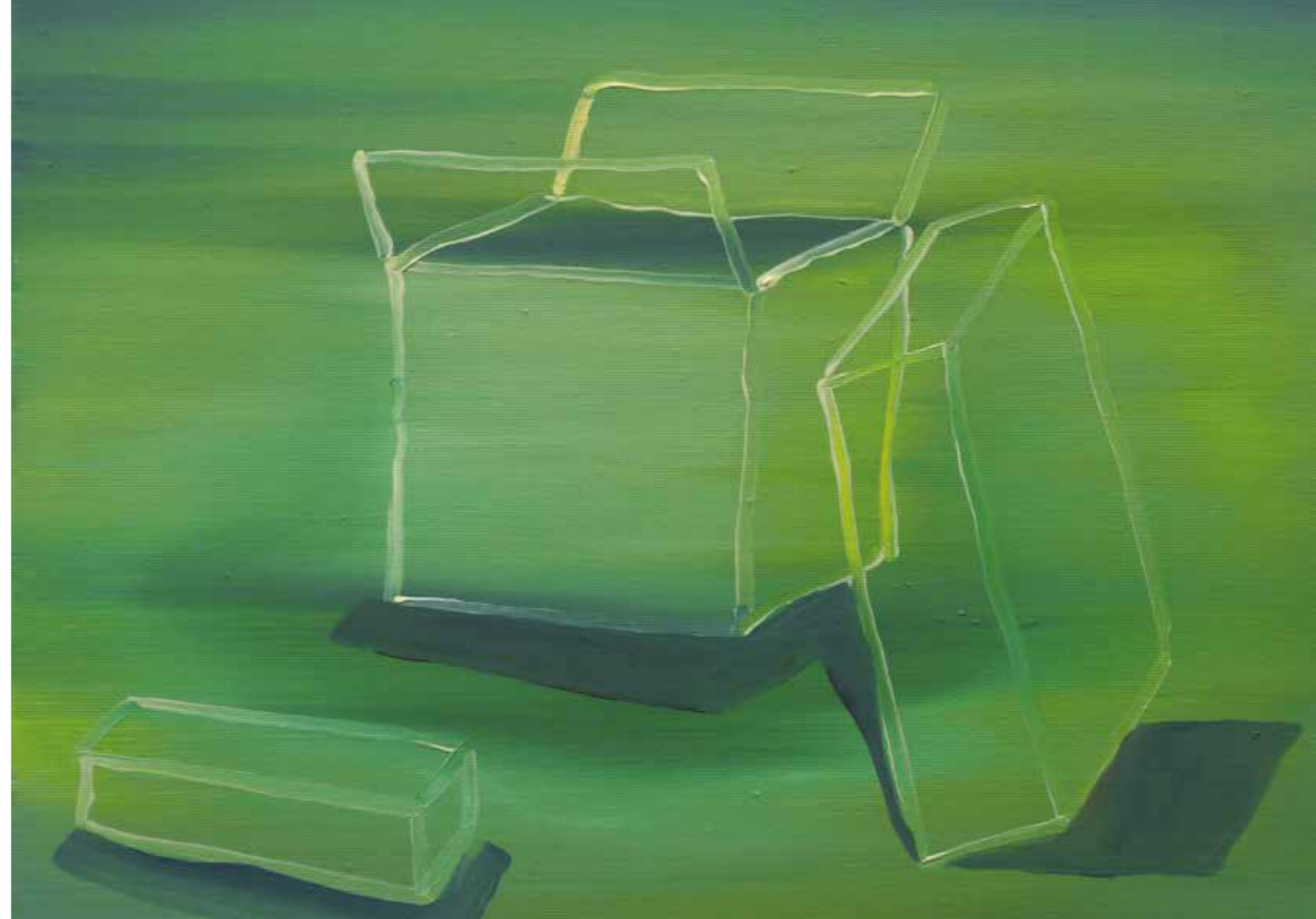
Abb. rechts: „Kartons“, 40 x 50 cm, Öl auf Leinwand, 2016