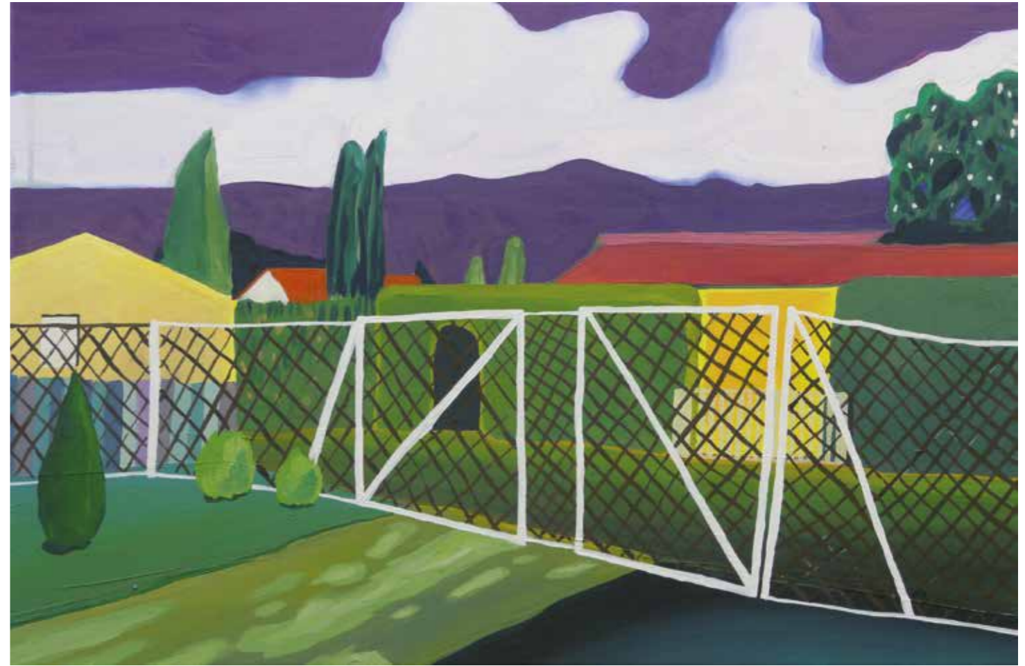
Abb. rechts: „Kleinkoschen“, 40 x 60 cm, Öl auf Leinwand, 2016