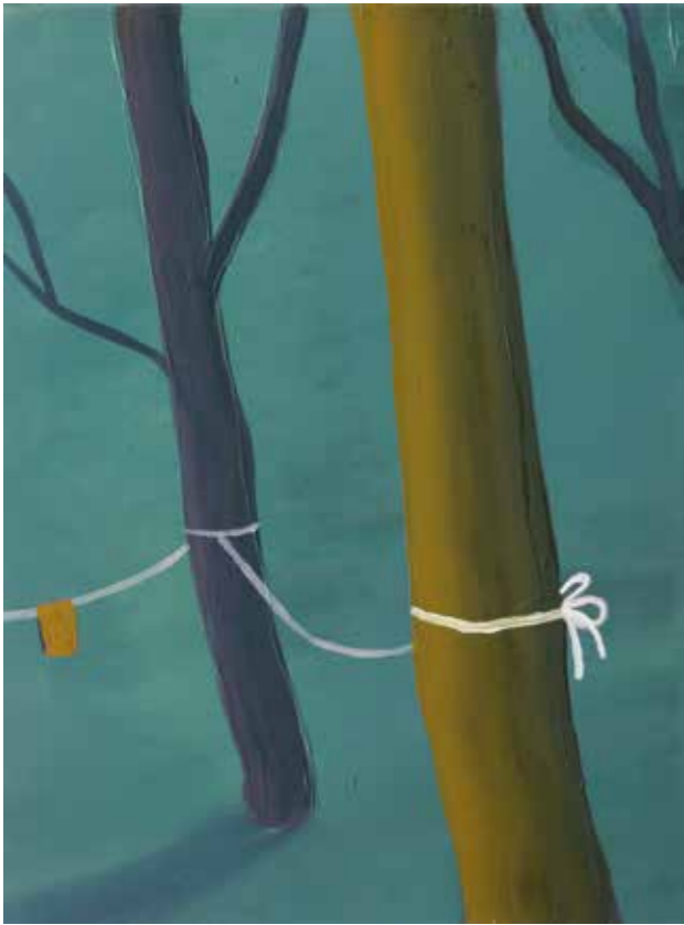
„Bäume (Wimpel)“, 40 x 30 cm, Öl auf Leinwand, 2016